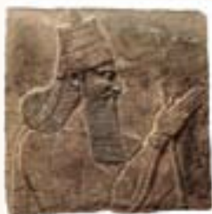
Deze afbeelding van de Assyrische koning Tiglath-Pileser III is gevonden in zijn paleis in Kalhu, 26 eeuwen na zijn inval in Israël in 746 v.C.

Op vrijwel elke pagina van de Bijbel komt u namen van personen of plaatsen tegen. Aangezien de Bijbel claimt feitelijke geschiedenis te bevatten, rust zijn geloofwaardigheid op zijn historische accuraatheid. Als de mensen, plaatsen en gebeurtenissen die in de Bijbel