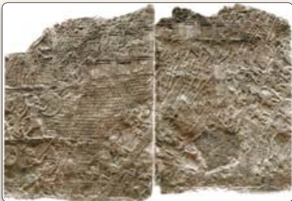
"In het veertiende jaar van koning Hizkia trok Sanherib, de koning van Assyrië, op tegen alle versterkte steden van Juda en nam ze in," aldus 2 Koningen 18:13. Dit reliëf uit Sanheribs paleis in Ninevé laat de Assyrische aanval van de Joodse vesting Lachis zien.

Eén van de grootste archeologische ontdekkingen aller tijden is de ontdekking van het oude Assyrische rijk. Assyrië verscheen vroeg in het tweede millennium v.C. voor het eerst op het toneel als rijk. De restanten van een ziggoerat, of tempeltoren, uit die tijd zijn nog altijd te vinden in de buurt van de oude hoofdstad ervan. In de negende eeuw v.C. ontpopte Assyrië zich als een agressief en machtig rijk. Tegen die tijd, zo'n 40 jaar na de regering van Salomo, was Israël opgesplitst in twee afzonderlijke koninkrijken – Israël en Juda (1 Koningen 12:16-24). Geleid door kundige en meedogenloze koningen begonnen de