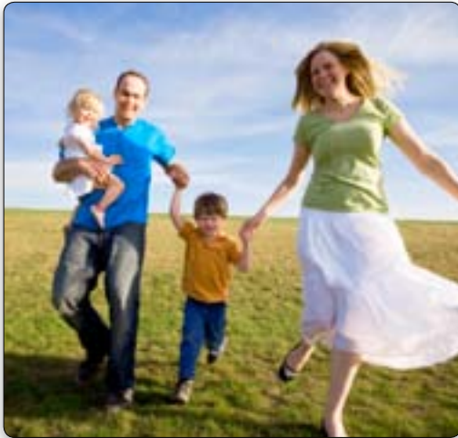
Drie keer per week dertig minuten bewegen en dagelijks 15 minuten lachen is vermoedelijk goed voor de bloedvaten.

Ware wetenschap en de Bijbel zijn niet strijdig met elkaar. Het is niet nodig dat voorstanders van welke zijde ook een slepende oorlog met de andere aangaan. Onbevooroordeeld onderzoek laat zien dat de wetenschap en de Schrift elkaar aanvullen en elkaar vaak bevestigen, zoals de voorbeelden in dit boekje laten zien.