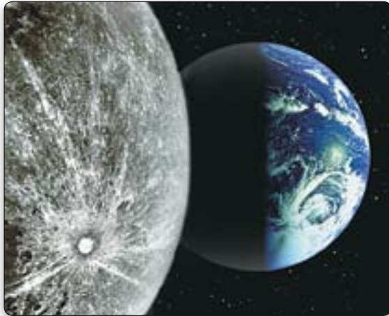
Is de aarde slechts 6000 jaar oud? Veel mensen nemen aan dat de Bijbel dit zegt, maar de oorspronkelijke tekst van Genesis 1 laat een veel vroegere schepping toe.

De “oerknal” is thans de meest populaire idee die ontwikkeld is om de schepping van een enorm en indrukwekkend universum te verklaren. Maar de theorie erkent dat het universum op een bepaald moment ontstond, ondanks dat degenen die deze theorie aanhangen en die niet in God geloven, niet kunnen uitleggen waar het materiaal vandaan kwam waar de oerknal zogenaamd uit voortkwam of hoe het universum tot