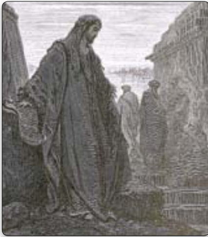
De profeet Daniël schreef enkele verbazingwekkend precieze profetieën neer. Deze bleken zó gedetailleerd en accuraat te zijn, dat sommige critici zich gedwongen zagen om te beweren dat ze niet waren opgeschreven vóór de gebeurtenissen, maar erná.

In Daniël 11 staat nóg een fenomenale profetie. De chronologische setting wordt gegeven in Daniël 10:1: "Het derde jaar van Kores, koning van Perzië." Een "man" (vers 5), ongetwijfeld een engel (vergelijk Daniël