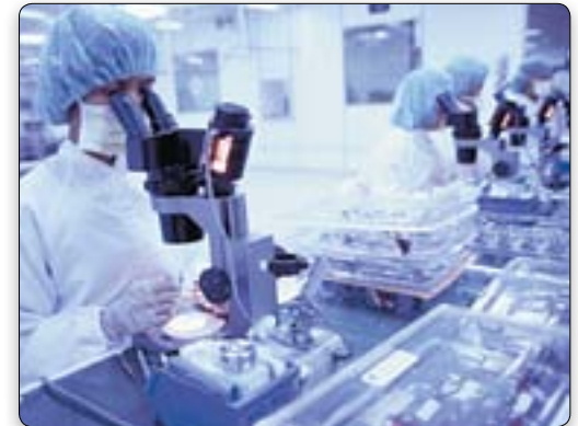
De Bijbel bevat praktische gezondheidswetten en –principes die, nadat ze veronachtzaamd of grotendeels vergeten waren, pas in recente decennia opnieuw zijn ontdekt.

We komen erachter dat ware wetenschappelijke kennis niet in strijd is met de Bijbel, maar ook dat de Bijbel niet in tegenspraak is met bewezen