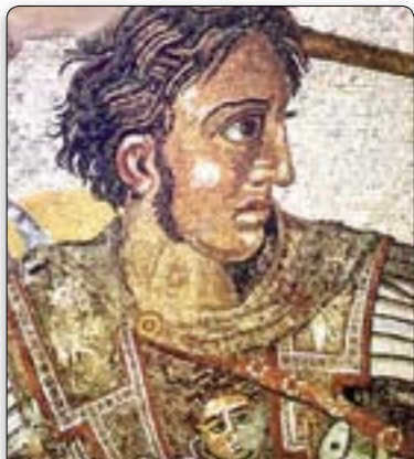
Het rijk van Alexander de Grote werd profeteerd door Daniël lang voordat Alexander het grootste gedeelte van de toen bekende wereld zou veroveren.

Laodice , de eerste vrouw van Antiochus II, werd verstoten. In 246 v.C. werd Antiochus II vergiftigd – waarvan men algemeen aanneemt dat de