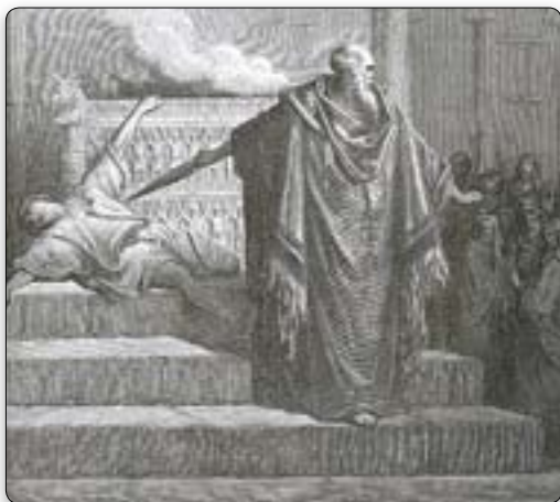
De Joodse priester Mattathias ontketende een opstand tegen Antiochus Epifanes toen hij met geweld weerstand bood tegen de door de koning opgelegde afgodendienst.