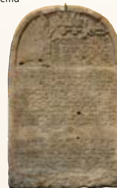
Op deze oude Assyrische stele is koning Sanherib te zien, bidtend tot zijn goden.

worden, maar ook honderden details, zoals steden, dorpen en zelfs specifieke bouwwerken in de Bijbel, zoals paleizen, baden en stadspoorten. Keer op keer laat het bewijs dat de archeologen naar boven hebben gehaald in de landen van de Bijbel, zien dat de Bijbel een werkelijk authentiek en accuraat oud document is.